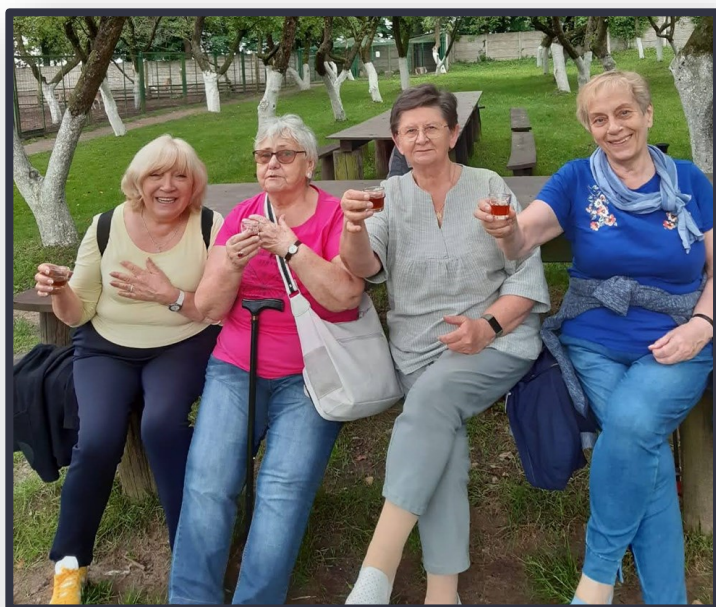
Na zdrowie !

Przebywając na świeżym powietrzu, w sielsko- anielskim nastroju, przy zabawie ze zwierzętami, niemalże zapo- mnieliśmy o posiłku, który czekał na nas w karczmie, która kiedyś była stodołą , apetyt bardzo wszystkim dopisał.