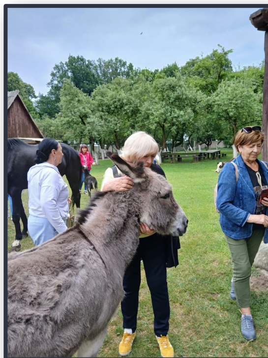
Mój młodszy brat .....